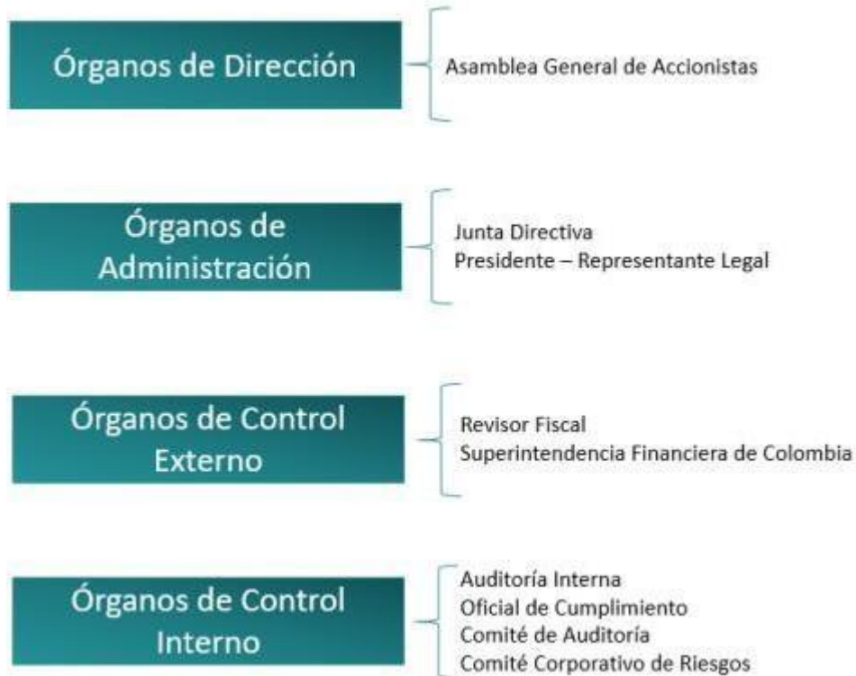
Cuadro No. 2. ÓRGANOS DE GOBIERNO DE RAPPIPAY